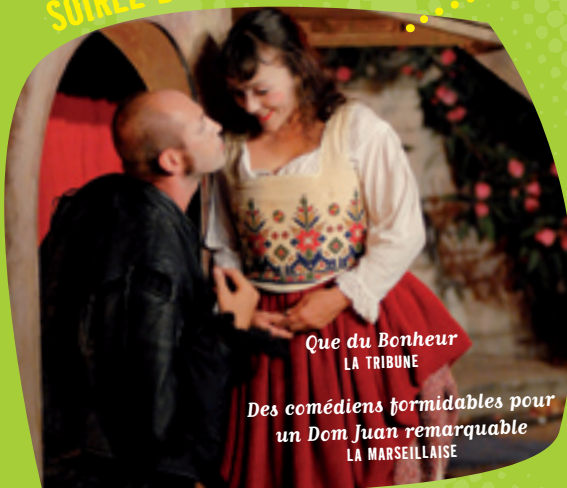
Que du Bonheur LA TRIBUNE