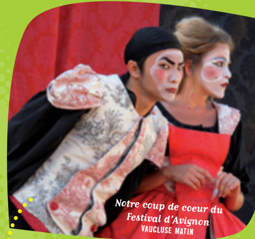
Notre coup de coeur du Festival d'Avignon VAUCLUSE MATIN