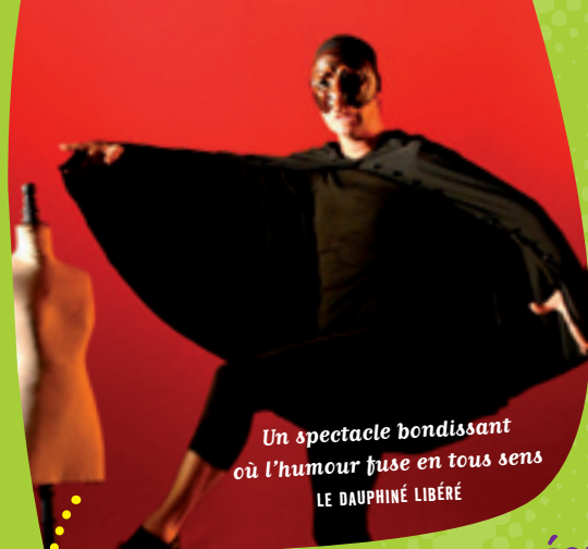
Un spectacle bondissant où l'humour fuse en tous sens LE DAUPHINÉ LIBÉRÉ

*Des Théâtres de Carton de Pauline Carton