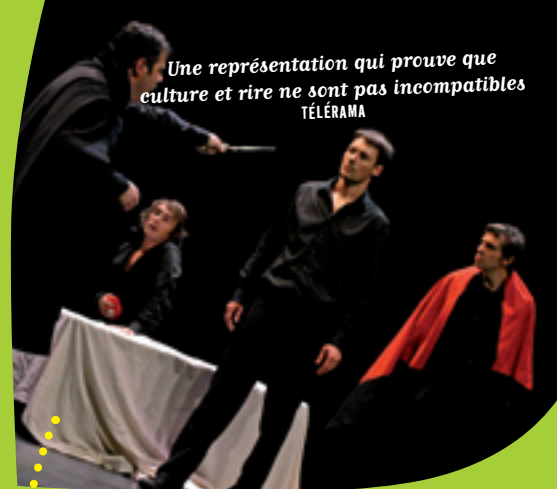
Une représentation qui prouve que culture et rire ne sont pas incompatibles TÉLÉRAMA