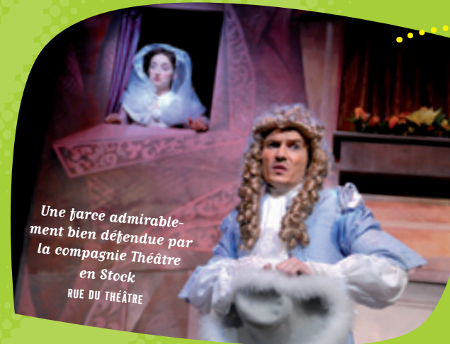
Une farce admirablement bien défendue par la compagnie Théâtre en Stock RUE DU THÉÂTRE