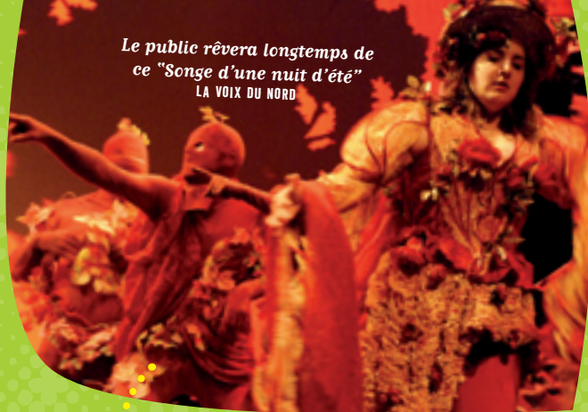
Le public rêvera longtemps de ce "Songe d'une nuit d'été" LA VOIX DU NORD